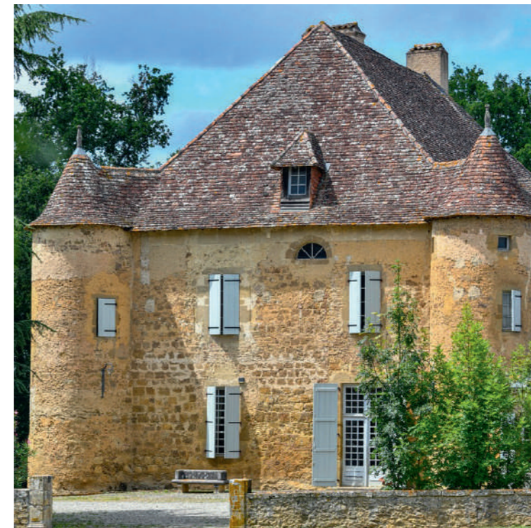
Château de Sabazan