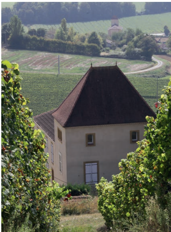
Château Les Bois Mathieu