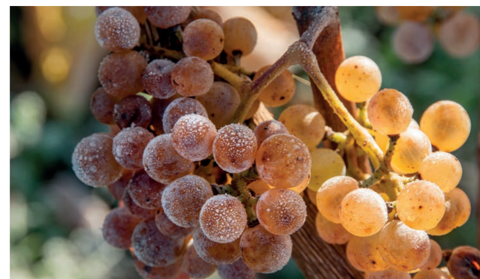
Grappe de Petit Manseng

Le vignoble du Château Arricau-Bordes aux sols d'argiles calcaires avec des graves fines et des galets est vendangé mi-novembre en 2 e trie. Il offre une cuvée à l'aromatique onctueuse et fraîche.