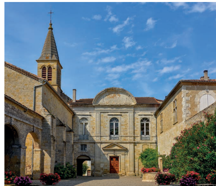
Château de Cassaigne