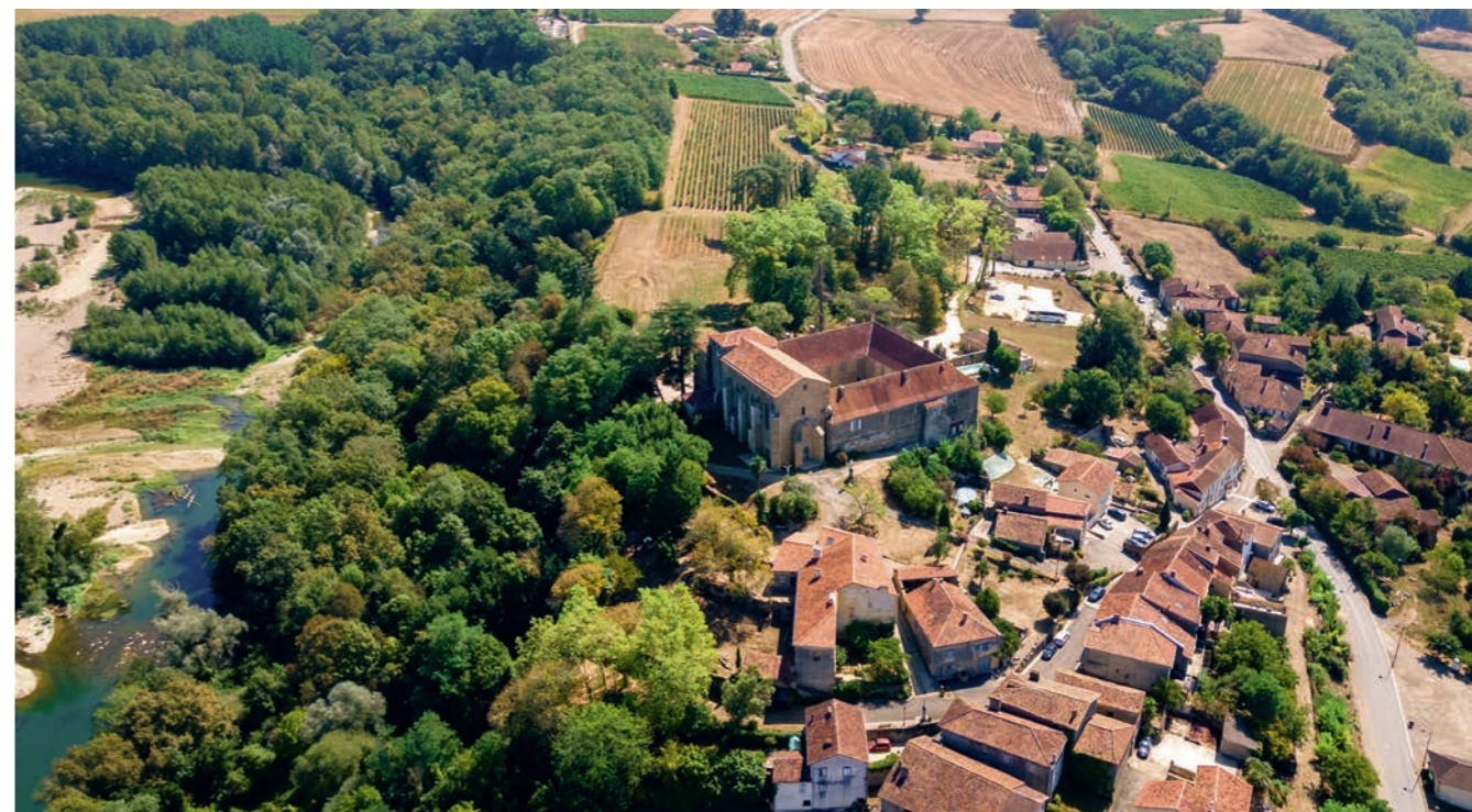
Vue du village de Saint-Mont, au centre le Monastère, hôtel et Spa***

Chaque millésime du Faîte concrétise un assemblage unique des plus belles expressions du terroir de l'AOC Saint Mont. Événement annuel, il est désormais incontournable des grands noms du vin et de la gastronomie.